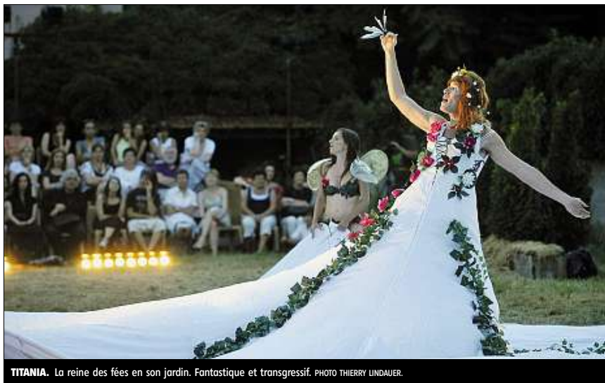
TITANIA. La reine des fées en son jardin. Fantastique et transgressif.

Et c'est plutôt réussi dans la fantaisie débridée, avec l'arrivée genre Starzky de deux baignoies dans la cour de la Bergerie... Des caisses remplies de mafeux qui débarquent à la cour du roi Thésée... C'est parti pour plus de deux heures de mise en scène speed de la cour au