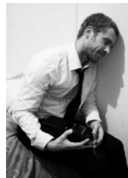
Figure de l'homme qui se nie, il fait partie du monde qui l'écrase ( les hommes s'essuieront les pieds sur lui ). Strict et assidu, il travaille comme assesseur au palais de justice où il a notamment rédigé des arrêts qui vont à l'encontre des droits des homosexuels. De ses droits. Ce qui lui vaudra d'être quitté par Louis.

C'est le personnage le plus insondable de la pièce car il est emprunt d'immobilisme permanent. C'est une figure de faiblesse. La fatalité incarnée (respectueux du devoir). Et même si une tentative de changement teinte son parcours dans la pièce (il tente de vivre sa sexualité dans une histoire vouée à l'échec avec Louis). Il reste attaché à une vision rassurante d'un monde conservateur et réactionnaire. « J'aime les paysages qui ne changent pas ». Mais le monde est plus fort que lui, les lois qui le gouvernent (religieuses et familiales) viendront à bout du désir qui lui ronge la poitrine. Combat perdu d'avance?